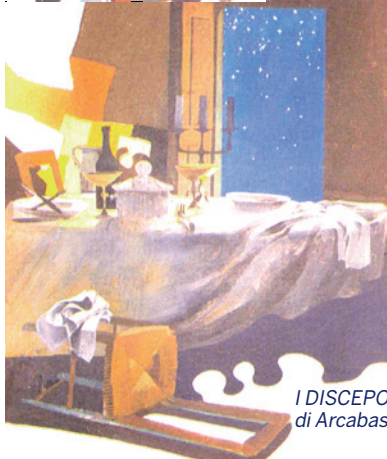
I DISCEPOLI DI EMMAUS di Arcabas, pittore sacro

Questo cammino, certamente doloroso per tante privazioni, lutti, soli-